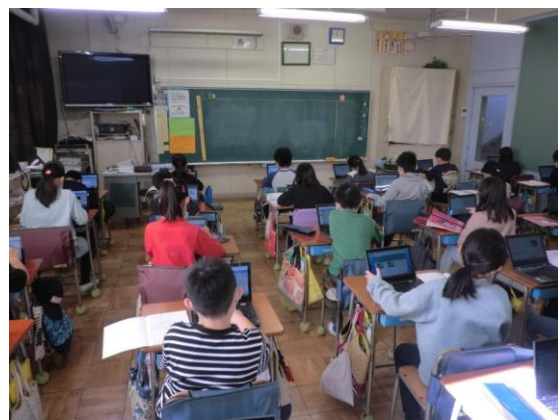
スクールタクトを活用しての詩集づくり (みんなで協力して、たった一つのクラスの詩集を作りました)