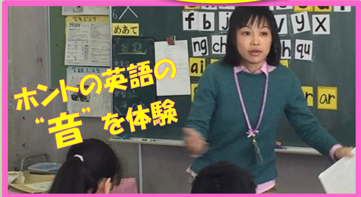
【英語】おともじ(Jフォニックス団体)