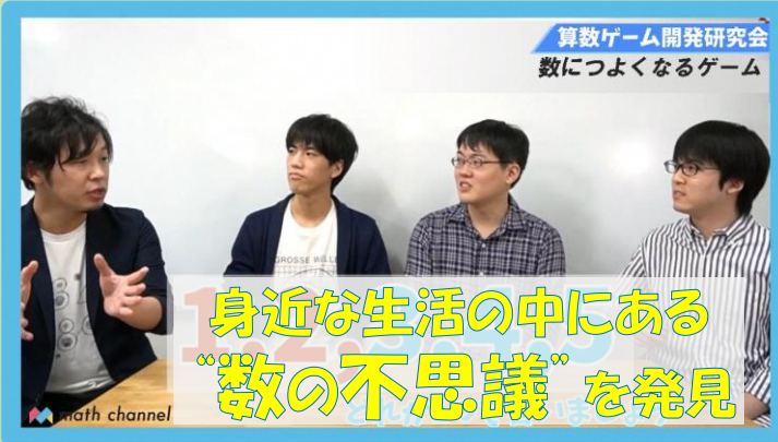
【算数数学】マスチャンネル(理数教育系YouTuber)