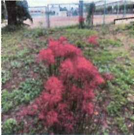
1中との境に咲く彼岸花

先日の運動会では、たくさんの温かい声援をありがとうございました。子どもたちの頑張る姿をしっかりと目に焼き付けていただけたでしょうか。